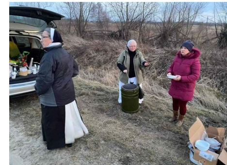
Bilder aus den ersten Tagen an den Transitstrecken aus der Ukraine nach Polen: Kongregation der Schwestern v. Hl. Dominik (Dominikanerinnen)